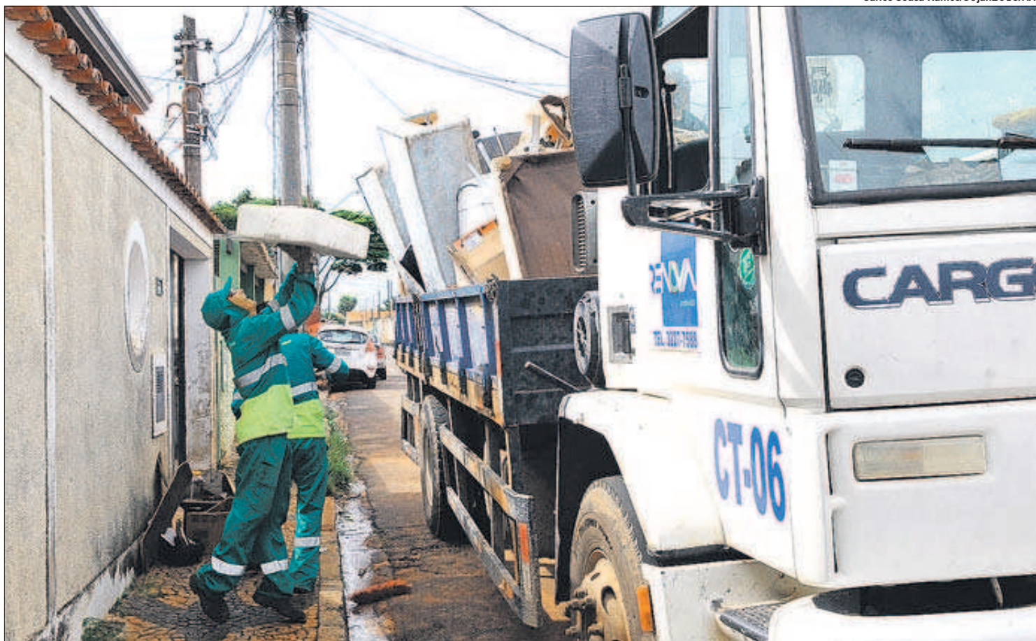
Agentes recolhem entulhos na Vila Costa e Silva, no mutirão realizado no último sábado: ações serão estendidas para toda a cidade pela Prefeitura