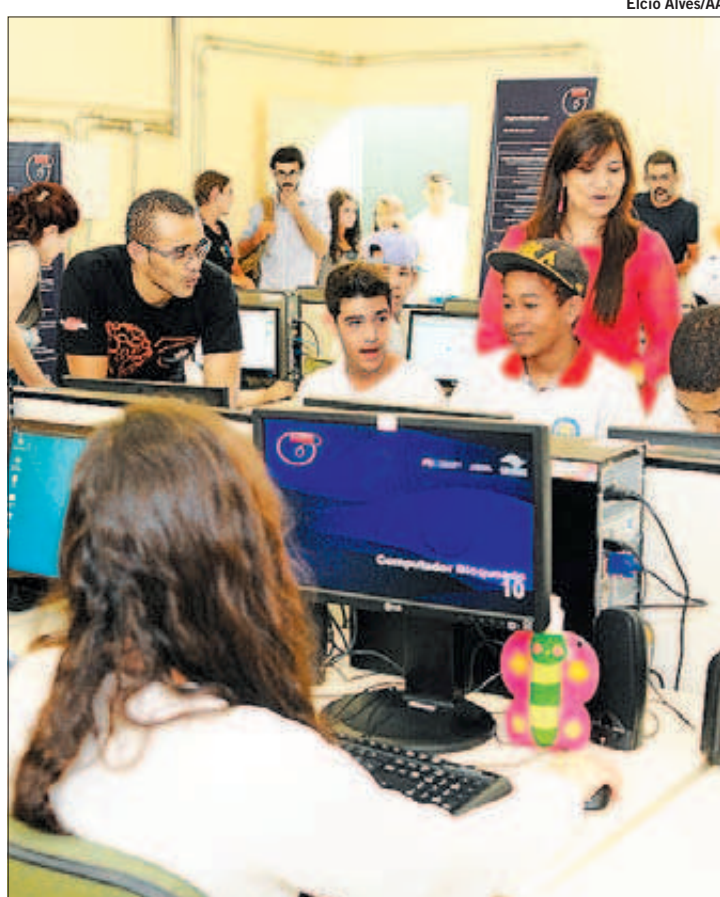
ALUNOS da Escola Estadual Professor José Vilagelin Neto, do Jardim Proença, experimentam a nova plataforma de ensino

inspirado no método Khan de ensino, e é composto por diversas videoaulas que duram de 7 a 15 minutos. Há também videoexercícios, onde o aluno pode ver o conhecimento teórico aplicado na prática, além de atividades interativas, em que cada exercício realizado possui pontuações, tornando, assim, o aprendizado mais leve e recompensador, uma espécie de jogo para aprender mais. Com a plataforma, o professor pode acompanhar o desenvolvimento da turma ou de um aluno específico, identificando quais são os exercícios que possuem maior facilidade e quais apresentam maior grau de dificuldade. A QMágico atende escolas públicas e privadas em parceria com ONGs. (Da Agência Anhanguera)