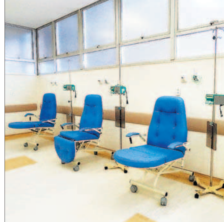
AMBULATÓRIO de Oncologia Clínica e Quimioterapia do Hospital de Clínicas conta agora com 14 poltronas especiais para tratamento