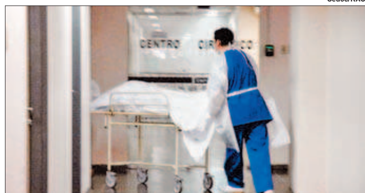
HOSPITAL DE CLÍNICAS da Unicamp comprou o equipamento, que deverá ser instalado em uma sala especial do centro cirúrgico