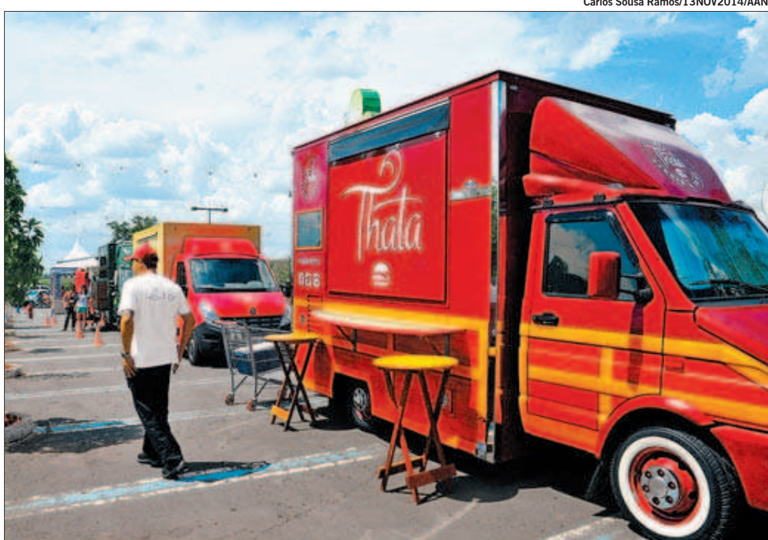
ESTACIONAMENTO DO SHOPPING D. Pedro recebeu no ano passado veículos adaptados especialmente para oferecer comida nas ruas, e que estão virando moda, após a regulamentação em várias cidades do País

Com a vida cada dia mais corrida, comer fora de casa já é um hábito para milhões de brasileiros. Os food trucks surgiram para atender a demanda de quem precisa comer rápido e busca por um preço bom. A partir de hoje até a próxima quinta-feira, das 17h às 22h, os campineiros poderão conferir a nova moda da comida preparada em veículos no estacionamento do Parque D. Pedro Shopping. Os organizadores esperam 35 mil pessoas e um faturamento superior a R$ 500 mil. O evento é realizado pelo segundo ano no local. A edição de 2015 ganhou mais espaço e trará operações de Campinas e região, além de nomes tradicionais nas ruas de São Paulo. Os organizadores esperam 30% a mais de público do que no ano passado. O curador do festival e sócio do food truck Massa na Caveira, Raphael Corrêa, afirmou que a expectativa para a edição deste ano é muito positiva porque a quantidade de público foi grande no ano passado. "O primeiro festival serviu para avaliarmos o interesse do público e também foi um grande aprendizado. Neste ano, estamos provendo mudanças na estrutura e a área está bem maior chegando a 5 mil metros quadrados. Teremos 43 operações com uma variedade grande de pratos e bebidas", disse. Ele calculou que o festival irá gerar mais de R$ 500 mil em receita para os expositores. Os pratos servidos vão variar de R$ 15,00 a R$ 30,00. "A previsão é que o tíquete médio ficará em R$ 20,00. Os visitantes vão