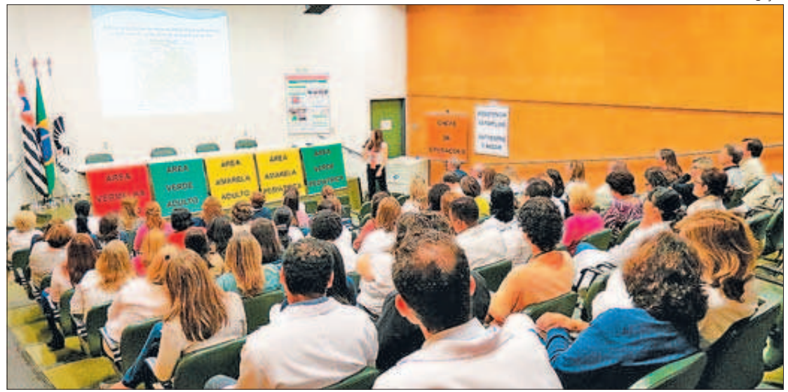
Apresentação do plano de contingência do Hospital de Clínicas da Unicamp para a Copa do Mundo

Hospital foi escolhido por estar em região vulnerável a acidentes com múltiplas vítimas