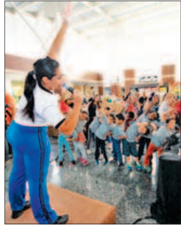
ALUNOS DE ESCOLA estadual participam de aula de ginástica