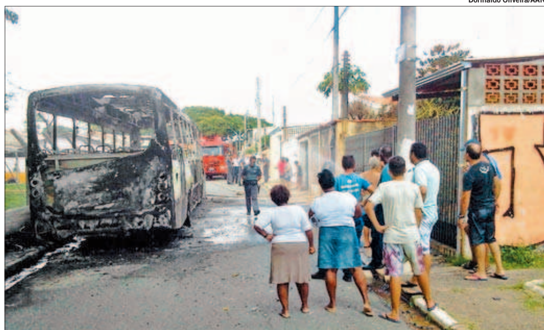
Um incêndio de causas desconhecidas destruiu ontem um ônibus escolar na Vila Castelo Branco, em Campinas. O veículo estava parado e vazio. O fogo foi controlado pelos bombeiros. As causas serão investigadas.