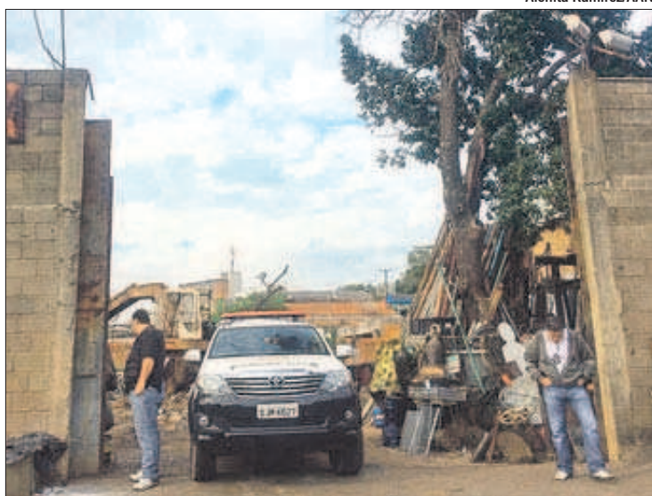
POLICIAIS CIVIS cumprem mandado de busca e apreensão em desmanche em Campinas: ao todo, investigação atinge 50 pessoas

A Polícia Civil de Americana prendeu, ontem de manhã, 14 pessoas suspeitas de integrar uma quadrilha de roubo, furtos e desmanche de veículos na região de Campinas. Entre os presos estão dois dos principais receptores do esquema de venda de peças de carros. Um deles é o proprietário da Fit Peças, na Vila Paraíso, em Campinas, e o outro é dono de uma loja de peças, em Goiânia, responsável pela distribuição do material para todo o Brasil, principalmente para o Norte e Nordeste. Do total de prisões, duas foram em flagrante — um por receptação e outro por porte ilegal de arma. Os demais tiveram prisões temporárias de cinco dias. A operação "Expresso de Lata" começou há oito meses, após a Delegacia Seccional ter constatado aumento no número de furtos e roubos de veículos na região. Num total, 50 pessoas são investigadas. Somente ontem foram cumpridos 40 mandados de busca e apreensão e 14 de prisões. Trinta e nove dos mandados de busca e apreensão foram cumpridos em Campinas, nos bairros Campos Eliseos, Jardim Aeroporto, Campo Belo, Vila União e Vila Rica. A maioria das prisões também ocorreu em Campinas — do empresário Márcio Greide, dono da Fit Peças, e do comerciante Edilson Ferreira Teixeira, dono de um