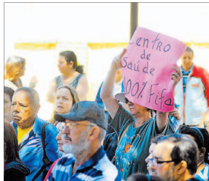
Moradora segura cartaz exigindo um Centro de Saúde “100% Fifa”