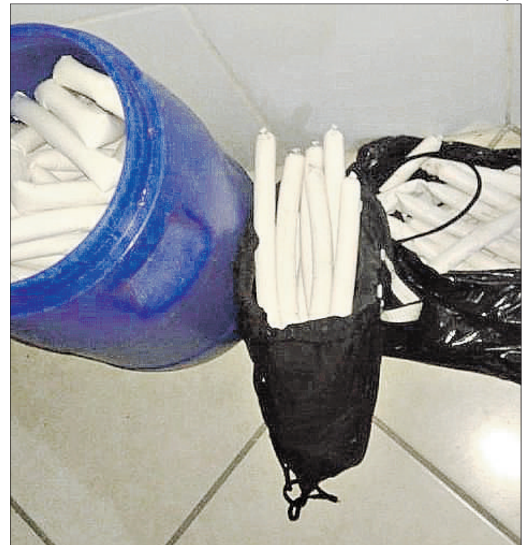
A PM encontrou o artefato dentro de tambores plásticos e em terreno baldio

Esse tipo de artefato é utilizado para ataques a caixas eletrônicas. Os policiais militares também apreenderam 5 munições calibre 22 para arma de fogo dentro da residência. O Grupo de Ações Táticas Especiais (GATE) de São Paulo, foi acionado e levou os explosivos para a delegacia para ser feito o Boletim de Ocorrência (BO) e depois para São Paulo, local onde os explosivos foram detonados. Os dois homens foram encaminhados para o plantão policial de Sumaré e autuados em flagrante. Já o adolescente foi liberado para os seus responsáveis. (AAN)