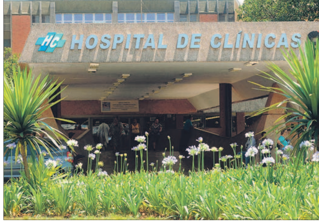
O HC da Unicamp suspendeu as internações pediátricas na última terça-feira: superlotação foi o motivo

classificação de risco ou redirecionadas à rede. Com o equipamento utilizado para radioterapia no Hospital Municipal Dr. Mário Gatti quebrado há 25 dias, pacientes