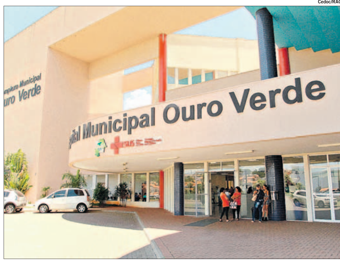
O Pronto-Atendimento do Ouro Verde está sobrecarregado e no momento prioriza as emergências

Já o Hospital de Clínicas da Unicamp decidiu manter as restrições nas internações pediátricas pelo menos até as 18h de amanhã, chegando a seis dias de suspensão. A medida emergencial foi tomada em virtude da superlotação na Urgência Pediátrica (UER), na UTI Pediátrica e na Enfermaria Pediátrica. A UTI Pediátrica do HC, que tem capacidade para atender 10 pacientes, voltou a ter 14 crianças internadas com ventilação mecânica e sem previsão de alta. As crianças graves da UTI são vítimas de bronquiolites — 5 casos —, especialmente o vírus sincicial respiratório (VSR), politraumas, doenças crônicas e pacientes aguardando transplantes. Na UER Infantil, a rotatividade dos leitos melhorou, mas ainda mantém crianças na observação. Já a Enfermaria de Pediatria, com 36 leitos, continua com sua capacidade máxima, inclusive com crianças em ventilação mecânica. Demandas espontâneas estão sendo atendidas e avaliadas pela