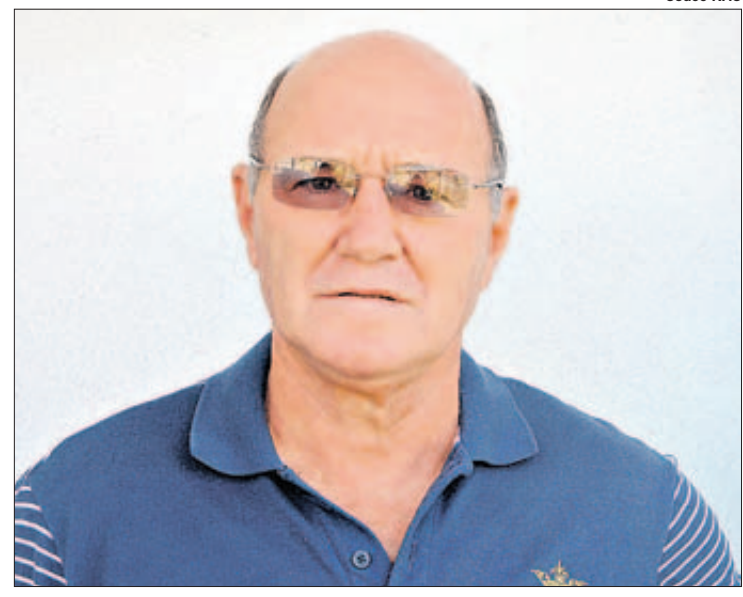
Político era conhecido por realizar encontro nacional da família Rosolen

monstrado sua preocupação com as carências culturais da cidade. “Campinas, terra de Carlos Gomes, nunca esteve tão renegada em termos de teatros nos últimos anos. Até o nosso maior patrimônio cultural, orgulho da cidade, que é a Orquestra Sinfônica Municipal, não tinha um espaço adequado até mesmo para fazer seus ensaios até bem pouco tempo. Não podemos esquecer que o governador autorizou a construção do novo Teatro Carlos Gomes no Parque Ecológico Monsenhor Emilio José Salim, mas nada saiu do papel”, escreveu. (Renato Piovesan/AAN)