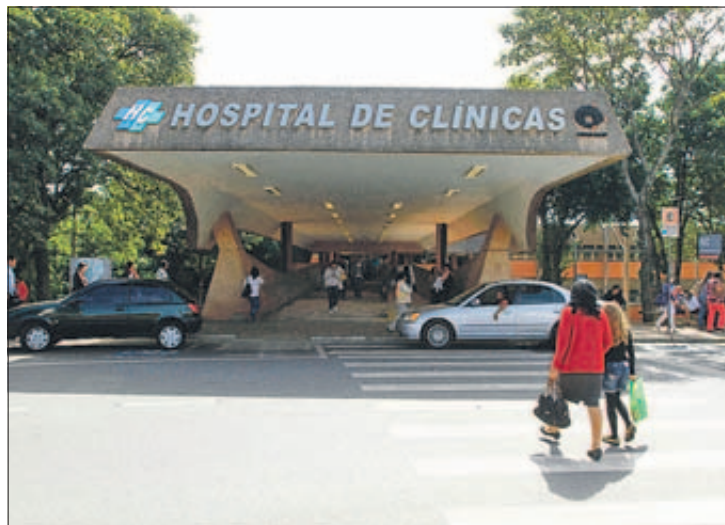
Entrada do HC, para onde são encaminhados casos de alta complexidade

identificar alterações patológicas na tomografia, identificar pacientes potencialmen-